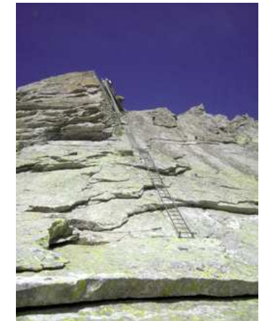
SAISON-HÖHEPUNKT 2011: Via Ferrata del Lago 3.137 m