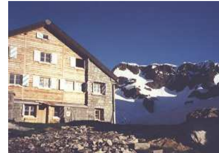
Eingetour 2011: Sustlihütte + Grassen 2.946 m