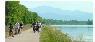
1. Mai - Radtour